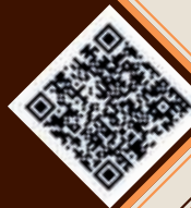
Foto senden und gewinnen! Es gibt wieder eine Sommerfoto-Mitmachaktion. Diesmal suchen wir Fotos von Kirchenfenstern. Teilnahmebedingungen finden Sie auf Seite 28.

Caritas Haussammlung Ihre Spende hilft Menschen in unserem Seelsorgeraum! Siehe Seite 2