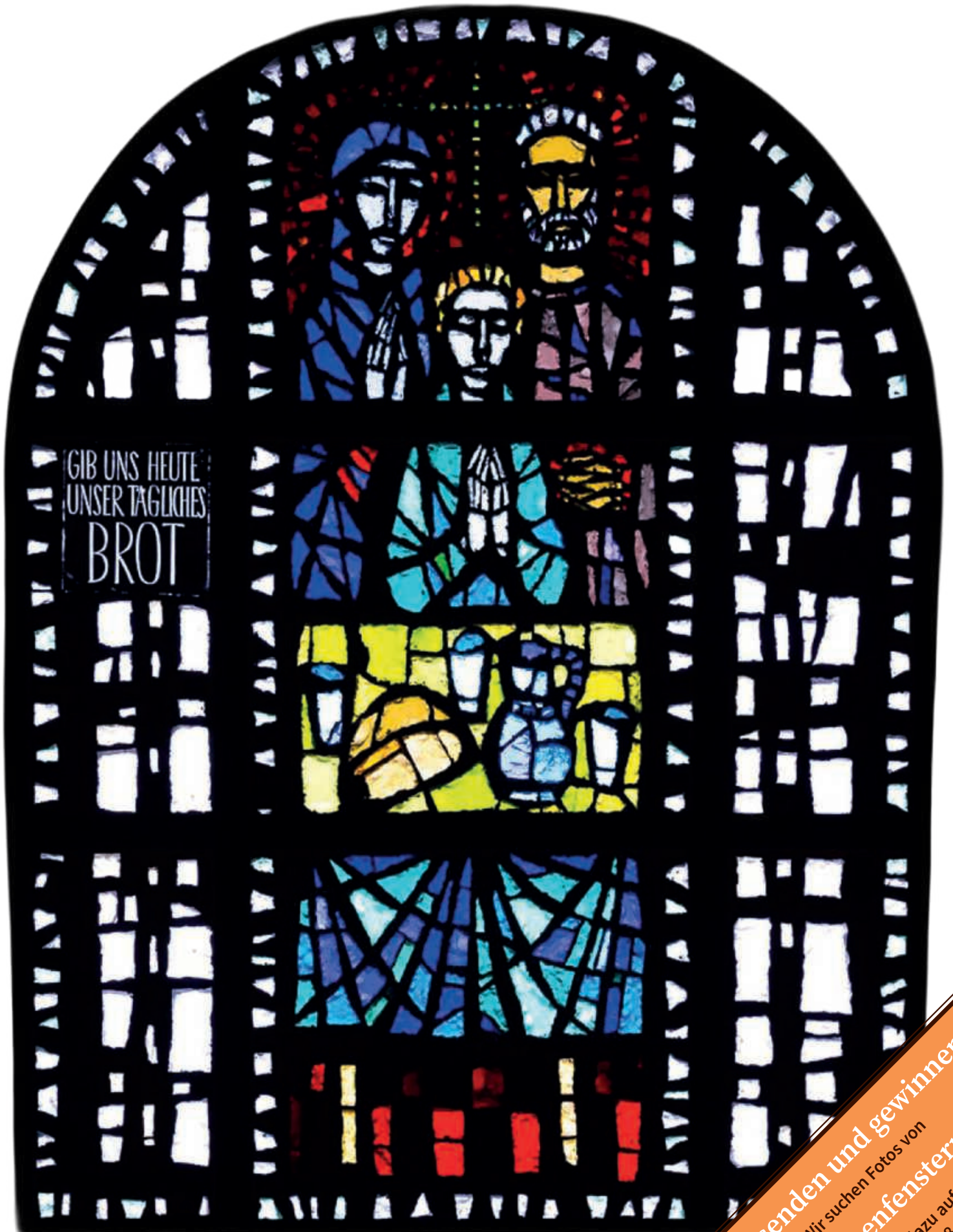
Bild: www.kath-kirche-kaernten.at , Pfarre Klagenfurt-St. Josef-Siebenhügel, © Martin Jorden

Foto senden und gewinnen! Wir suchen Fotos von Kirchenfenstern. Mehr dazu auf Seite 28.